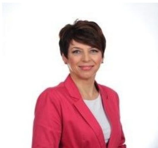
Śląski Kurator Oświaty Urszula Bauer