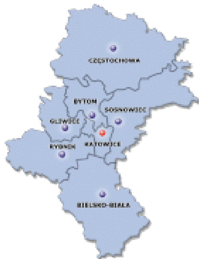
Kuratorium Oświaty w Katowicach